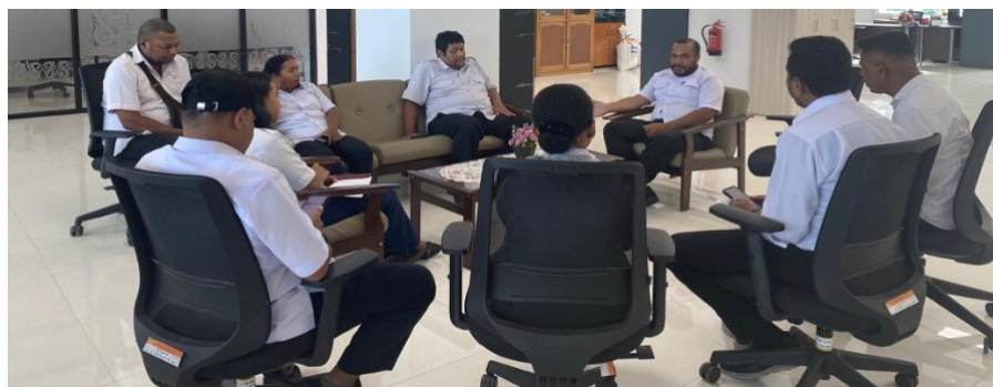
Gambar 2.2 Pembahasan Bersama PJ Gubernur dan PJ Sekda