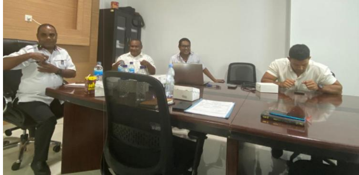
Gambar 2.3 Pembahasan di Biro Hukum Setda Provinsi Papua